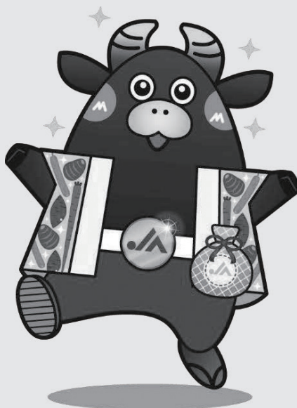
〈JA都城キャラクター ベブエモン〉

JA都城は畜産のまち「都城」を全国的にアピールすることなどを目的に作成された牛のキャラクター「ベブエモン」です。JA都城と地域の皆様とのタッチポイントやコミュニケーションツールとして商品ロゴでの活用やイベントなどに積極的に参加しますのでかわいがってくださいね。