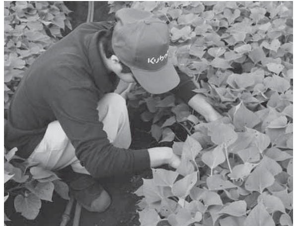
▶農業を問わず手で害虫駆除