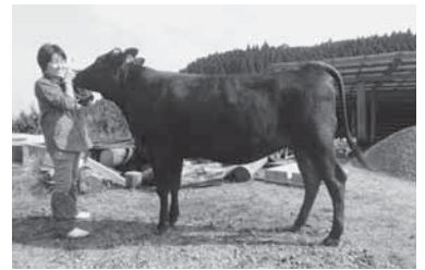
▲第2類チャンピオンの「ななえ」号と西郷さん