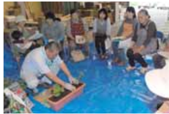
▲J A 都城女性部中央支部は5月11日に、「朝霧の里みやこんじょグリーンセンター」で、緑のカーテン講習会を開催しました。中央統括支所営農経済課の園芸指導員が講師を努め、栽培講習会を行いました。