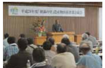
▲「朝霧の里」農産物出荷者部会(5/8)