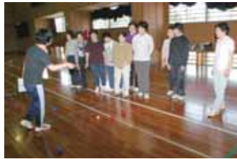
▲J A 都城おもと部会高崎支部は、5月24日、大牟田地区体育館で健康教室を開催しました。都城市スポーツ推進員の指導のもと、老若男女でも簡単に楽しむことの出来る競技、二チレグボールを行いました。