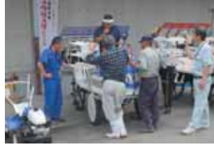
5月23日、24日に安久支所で展示即売会を開催。女性部振舞いなどたくさんのお客さんで賑わいました。