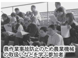
農作業事故防止のため農業機械の取扱いなどを学ぶ参加者

農作業事故防止を目的に5月10日、農業機械などについて学ぶ機会が少ない女性と新規就農者を対象に、畜市場で農作業安全講習会を開きました。講習会では、今からの時期使用頻度が多くなるトラクターや草刈り機、田植え機3種類の機械を実際に用いて、安全に作業を行うために必要な、農業機械の基本的な操作や取扱い、注意しなければならない点を学びました。