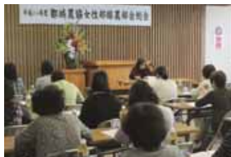
▲J A 都城女性部酪農部会(5/13)