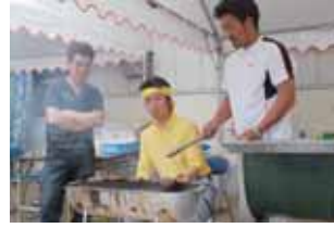
西岳支所は5月16日、17日の二日間で春の農作業用品展示即売会を行いました。16日には青年部、17日には女性部の振舞いが行われ、大変盛り上がりしました。