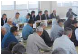
▲樺山地区集落営農組合(4/27)