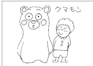
だつくようこそさん(山田)