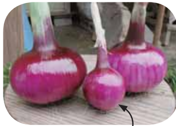
コしがぶつうの大きさです