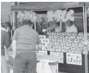
▲お客さんらに都城産マンゴーの試食、販売を呼び掛ける生産者

都城産完熟マンゴーの消費拡大を目的に、JA都城マンゴー生産部会は5月7日、都市の池田宜永市長と三股町の木佐貫辰生町長に完熟マンゴー『太陽のたまご』1ケース(1kg)を贈呈しました。また、5月11日と12日に、「朝霧の里みやこんじょ直売所ATOM」で、完熟マンゴーフェアを開催し、完熟マンゴーを買い求める多くのお客さんで賑わいました。マンゴーフェアには、部会員と同JA関係者合わせて20人が参加し、都城産マンゴーの試食や即売会を行い、200kgのマンゴーが、完売するほど大盛況でした。