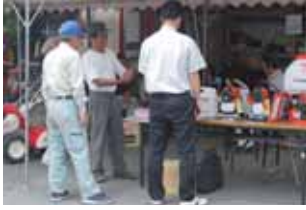
五十市支所は、5月23日に農機具展示会を開催しました。生活用品や農産物販売など多くのお客さんで賑わいました。