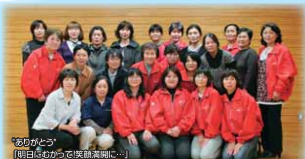
「ありがとう」 「明日にむかって!笑顔満開に...」 同じ空の下頑張ろう モーモー母ちゃん宮崎で会いましょう 宮崎大会実行委員