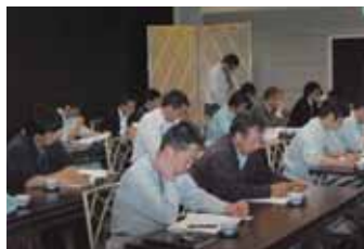
▲営振協普通作部会(4/25)