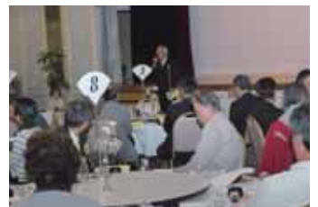
▲J A 都城共済代理店連絡協議会(4/22)