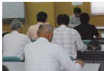
▲J A 都城花卉生産部会(5/15)