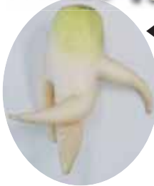
庄内支所にかわったダイコンが届きました。