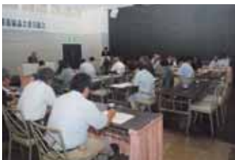
▲安久地域営農推進協議会委員(5/22)