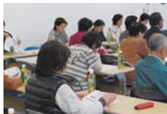
▲「朝霧の里」加工品出荷者協会(4/23)